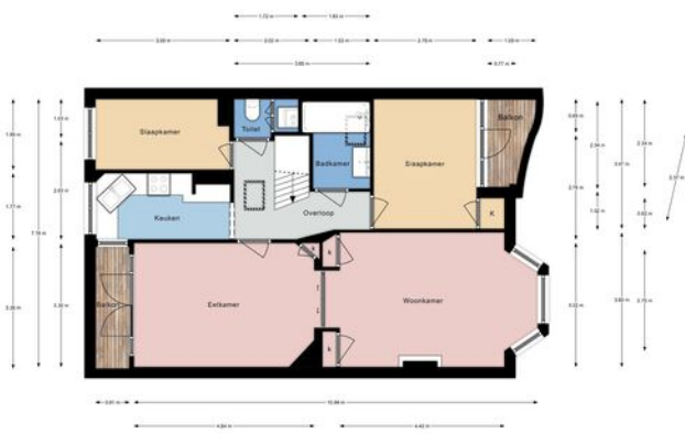
Van der Capellenstraat 6, Den Haag | 2e Verdieping H = 2.91 m